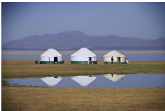
Son Kul lago