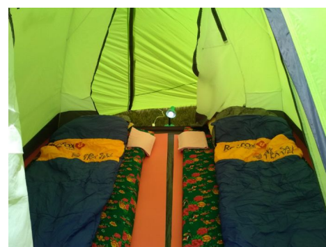
Campamento de Kel Suu