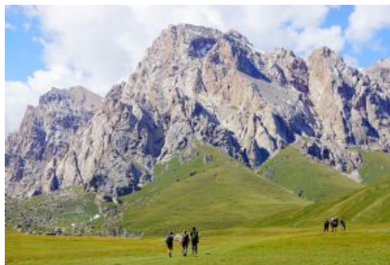
Llegada Kel Su