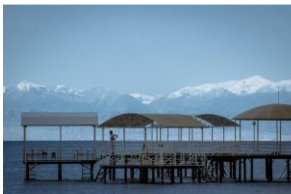
Issy Kul lago