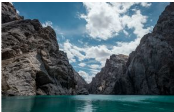
Kel Suu Lago