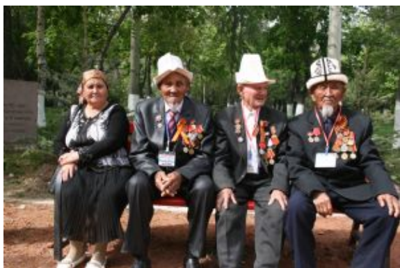
Gente de karakol