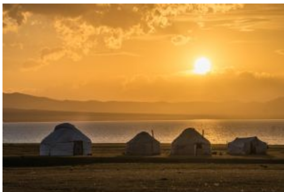
Son Kul Lago