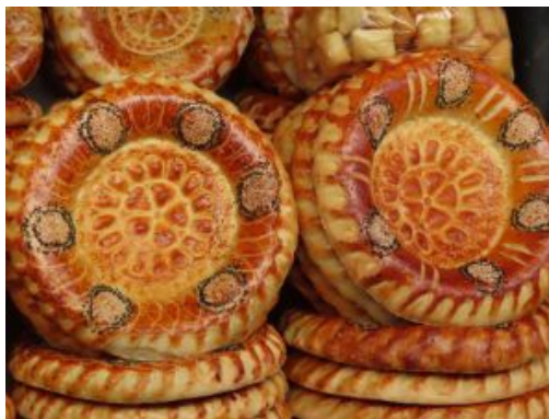
Pa naan Mercat