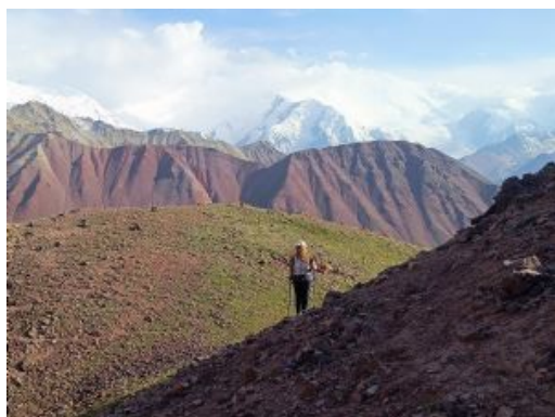
Día 5 - Descenso al Campamento Base