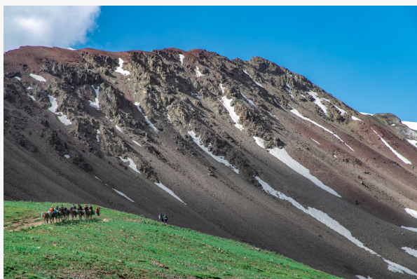
Trekk Paso Viajeros