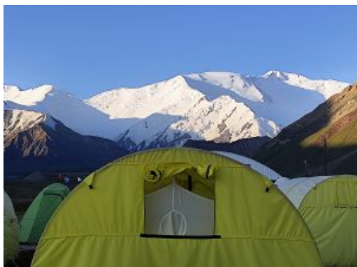
Campo Base 3