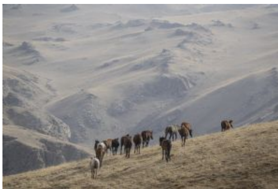
De vuelta a casa