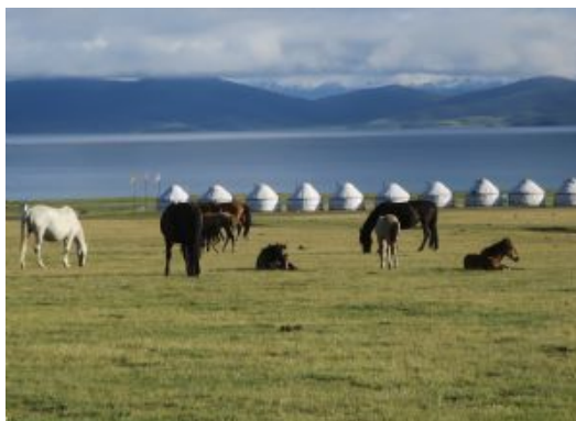
Son Kul Lago