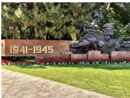
Almaty. Parque de los 28 Panfilovtsev