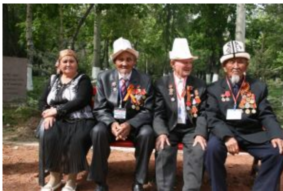
Gente de karakol