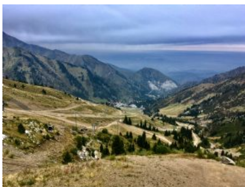
Vistas desde Shymbulak