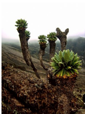
Kilimanjaro naturaleza