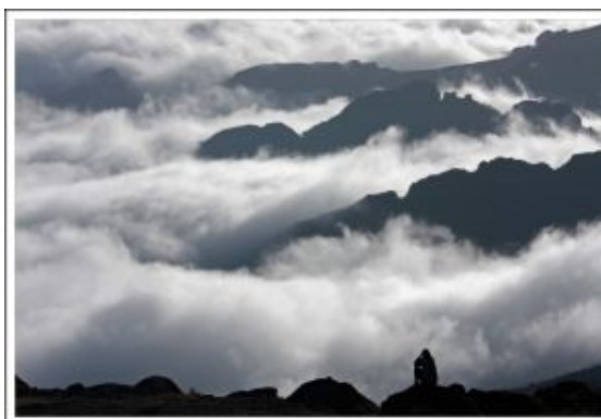
Tanzania Un mar diferente