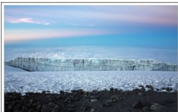
Tanzania Regalo para unos ojos helados

Se puede simplemente reposar en el refugio o atacar la ascensión campo base de Mawenzi.