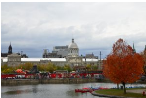
Alex Póo Foto: Montreal 4