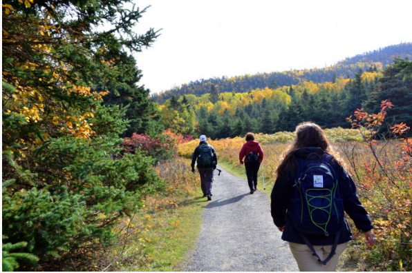
BIC P.N. 5

En las webs de cada uno de los parques y que indicamos en el itinerario os podéis descargar las guías de cada uno de ellos (en inglés y/o francés) en las que encontraréis informaciones sobre las distintas caminatas y otras informaciones de carácter útil.