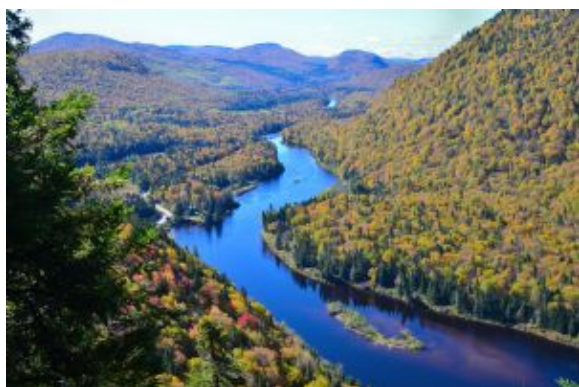
Jacques Cartier NP 5

Recorrido por carretera: 350 km / 4 horas aprox.