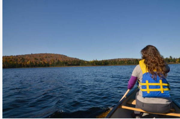
Canoa en lago