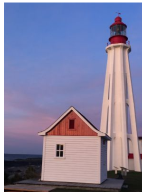
Alex Póo Foto: Rimouski_faro de Pointe au Père