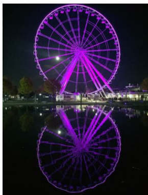
Alex Póo Foto: Montreal by night