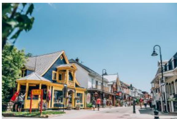
Baie St Paul

Traslado por carretera: 370 km / 4 hrs aprox. - Caminata P.N. Grands Jardins: 1-1,30 hrs. aprox.