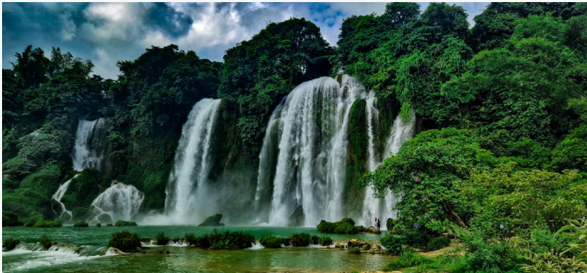
Trekk Cao bang