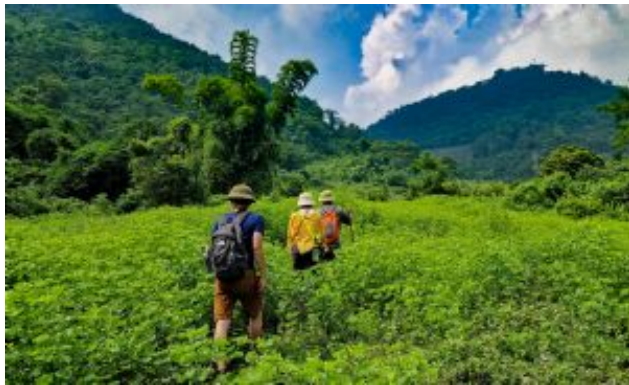
P.N. Ba Be