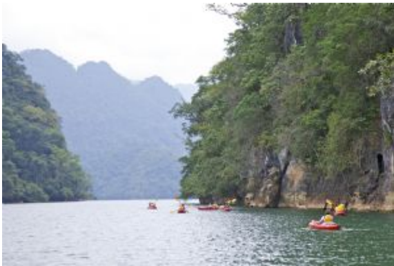
Lago Ba Be