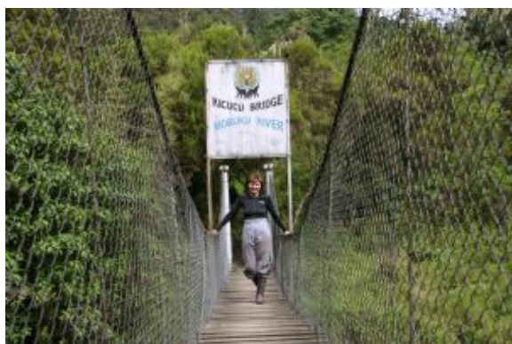
Paisajes de Uganda

Equipo: Son muy recomendables los prismáticos. De los 38 km que tiene el canal, se navegará desde el embarcadero de Mweya hasta la salida del canal al lago Eduard y regreso.