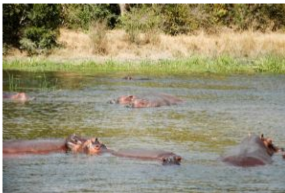
Murchison Falls N P