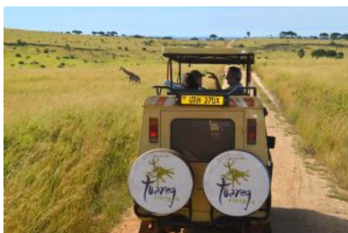
Vehículo de safari

Equipo: Aconsejamos el uso de pantalón largo y calzado cerrado y de suela grabada antideslizante, debido a la densa zona de gramíneas que atravesaremos o posibles zonas encharcadas que pueden encontrarse.