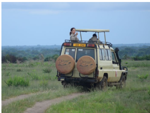
Vehículo 4x4, safari en Uganda

El recorrido se realiza en vehículos 4x4 tipo Toyota Landcruiser, todos ellos adaptados a estas rutas y con techos practicables para la mejor observación de la fauna durante los safaris. Cada viajero dispone de una ventanilla para mejor visibilidad. Por razones de espacio y comodidad se limita el equipaje a una pieza de máximo 15 Kg. y se deben evitar las maletas rígidas, recomendándose bolsa o mochila flexibles.