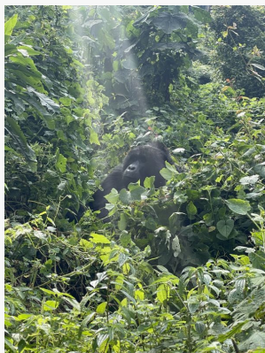
Silver Back

Para saber más sobre los Gorilas de Montaña