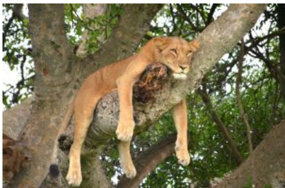
Queen Elisabeth N.P