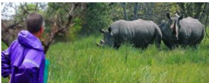
Rinocerontes en Ziwa