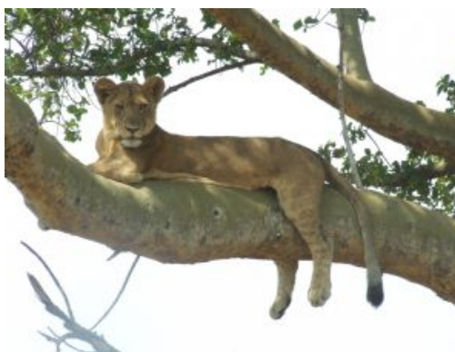
Canal de Kazinga