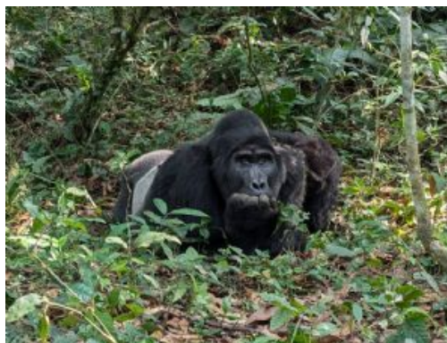
Miradas de Bwindi