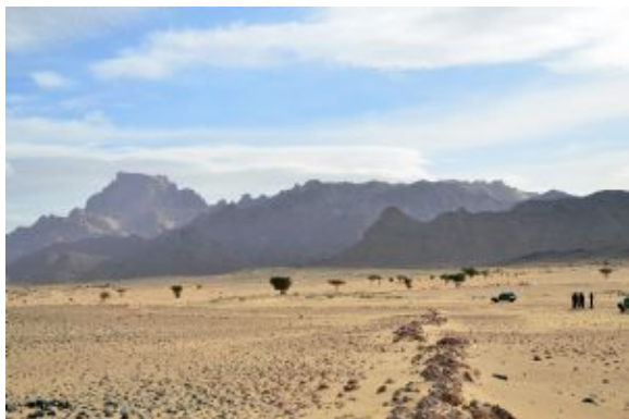
Tefedest_Garet el Djenoun_II

Continuamos nuestra ruta hacia la base del Garet El Djenoun, la cima y extremo norte de la sierra del Tefedest. Aquí veremos ya la transición del paisaje entre las dos vertientes de la montaña y seguiremos descubriendo abrigos donde se conservan pinturas y grabados rupestres.