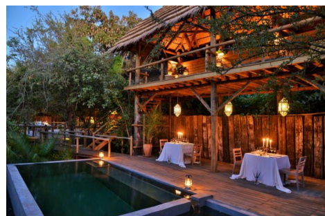
Chobe Bakwena Lodge