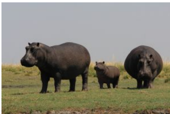
Hipopótamos en Chobe

Traslado por carretera al aeródromo de 15 min aprox. + vuelo en avioneta de 60 minutos