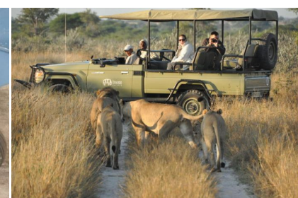
Vehículo abierto de safari