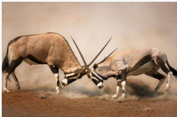
Órices en Kalahari Game Reserve