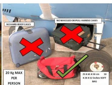
Restricciones de equipaje