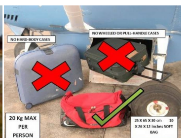
Restricciones de equipaje