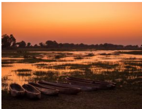
Atardecer en el Delta