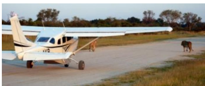
Avionetas en Botswana

En caso de llegar con exceso de equipaje sin previo aviso, el personal podrá retener la bolsa para transportarla posteriormente con un retraso y coste extra considerable para el viajero.