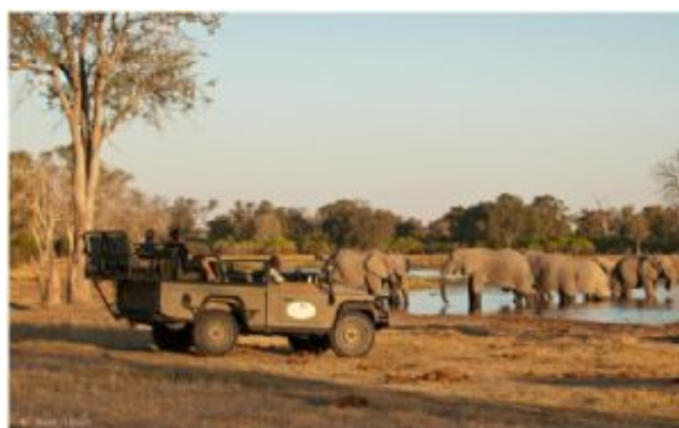
Safari en Moremi