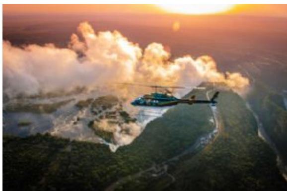
Sobrevuelo Cataratas Victoria

Traslado por carretera 75km / 1h20 min aproximadamente, excluyendo parada para el cruce de frontera.