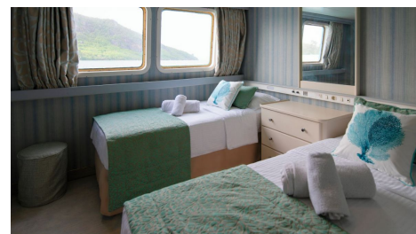
Cabina Categoría C

Para más información sobre la embarcación consultar el apartado "Transportes".