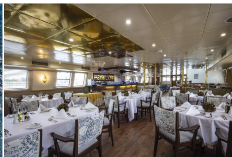
Comedor interior Pegasos