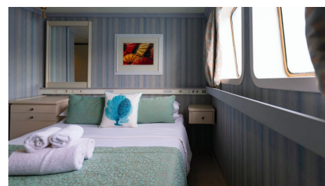
Cabina Categoría B