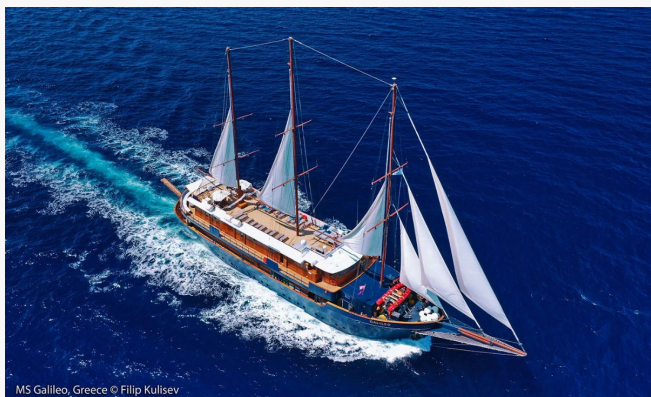
MS Galileo, Greece

La vida a bordo discurre entre los espacios comunes exteriores e interiores, con espacios para socializar o descansar en compañía de un buen libro. Cada día se realizan paradas para nadar y descansar en playas o calas recónditas o bien para realizar excursiones en tierra.