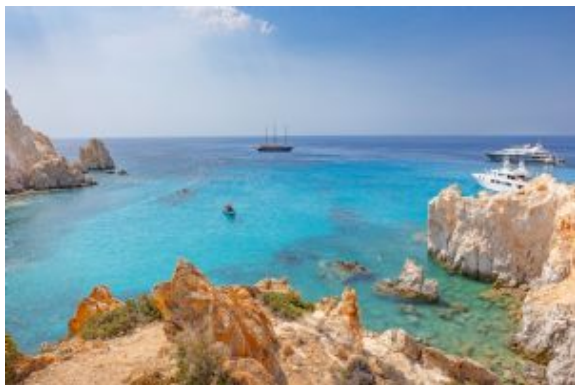
Navegación por las Cícladas

Después de desayunar tendrá lugar el desembarco, entre las 08.00 y las 09.00 horas. Fin de los servicios.