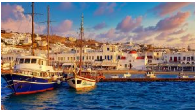
Puerto de Mykonos