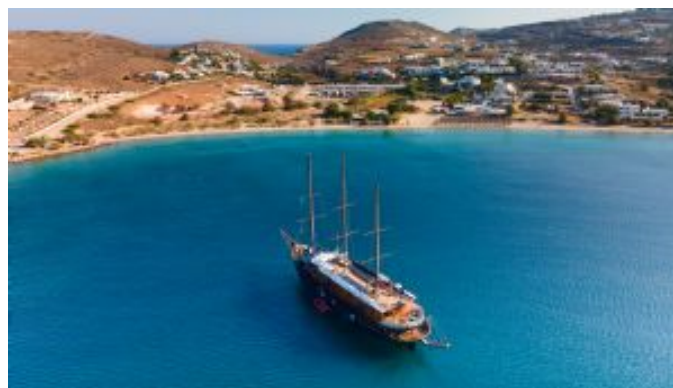
Navegación por las islas Griegas