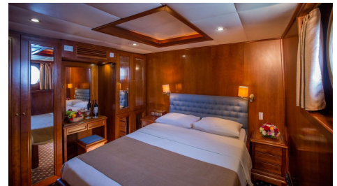
Cabina Cat. A

Para más información sobre la embarcación consultar el apartado 'Transportes'.