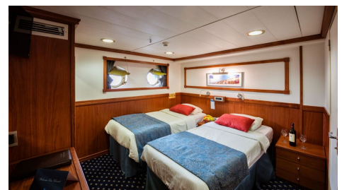
Cabina Categoría B