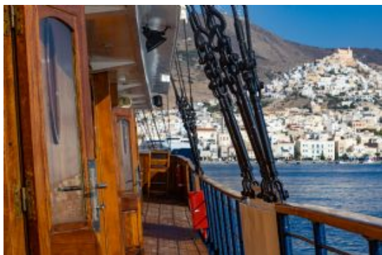
Navegación por las islas Griegas

Folegandros es la isla más pequeña de las Cícladas. De ambiente tranquilo y tradicional, no pasan inadvertidas sus playas, sus acantilados y su pequeña población de casitas blancas y calles empedradas.