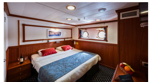
Cabina Categoría C