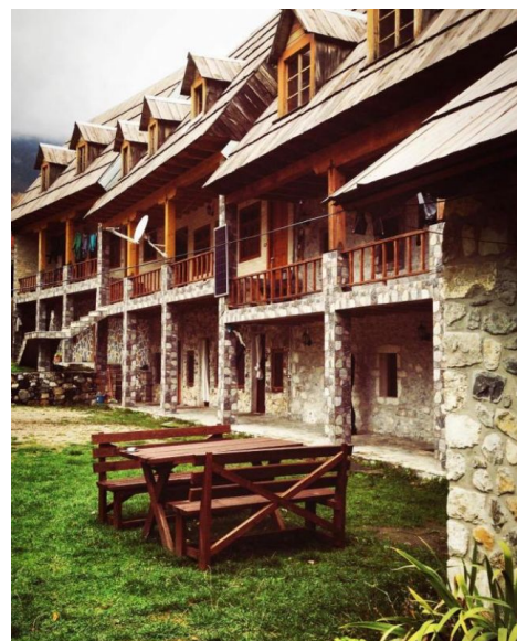
Casa local Theth