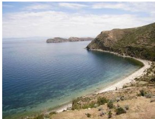
Isla del Sol