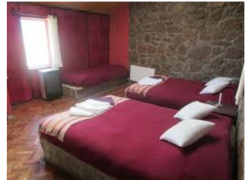
Hotel Tayka Desierto Ojo de Perdiz

Habitación triple: Pocos hoteles disponen de habitaciones triples. Suelen facilitar una doble a la que se añade una cama suplementaria, quedando limitados el espacio libre y el confort. Conviene tenerlo en cuenta antes de solicitar la reserva de una habitación de esa capacidad (caso de que viajen tres personas juntas) o de solicitar la inscripción como “habitación a compartir”.