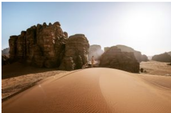
Tabuk - Hismah Mts

En el noroeste de la península arábiga se extiende el desierto de Bajda / Hismah, que forma la parte sur del popular Wadi Rum jordano. Las escénicas formaciones rocosas y la arena rojiza recuerdan a su vecino del norte, pero aquí la cantidad de visitantes es mínima, lo que nos permitirá disfrutar del silencio y la inmensidad de este entorno casi virgen.