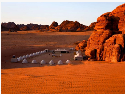
Tabuk Desert Camp 4