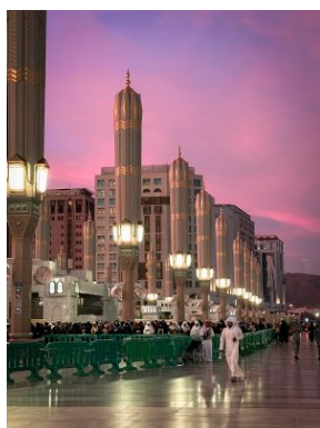
Xavi Mazcaray