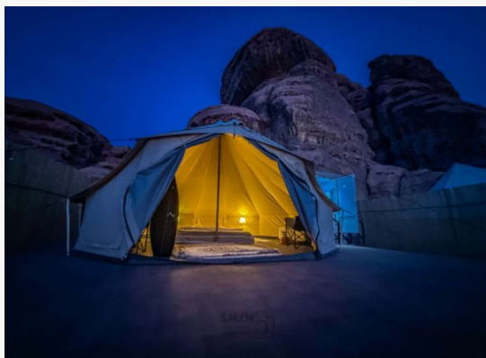
Tabuk Desert Camp 3

Los baños y duchas son compartidos y se encuentran en módulos situados en el exterior de las tiendas, ofreciendo instalaciones limpias y modernas. El campamento dispone también de una gran carpa común, donde se sirven las comidas y se comparte el tiempo de descanso bajo un techo decorado con luces y alfombras tradicionales. Por la noche, si el cielo está despejado, la ausencia de contaminación lumínica permite disfrutar de un espectáculo de estrellas.