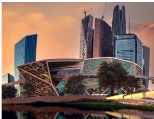
Riad - KADF