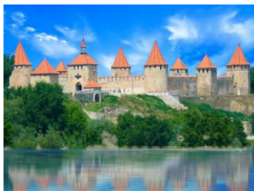
Fortaleza de Tighina