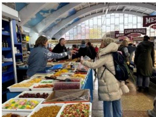
Mercado en Balti

Trayecto en vehículo: 100 km, 2 h aprox.