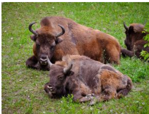
Bisontes en el parque natural de Padurea Domneasca