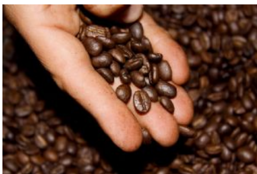
Eje cafetero_cafe 8

Trayecto en vehículo: 60 kms - 1,5 horas