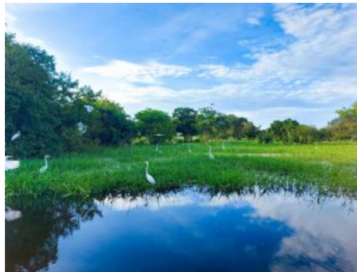
Ciénaga de Pijiño