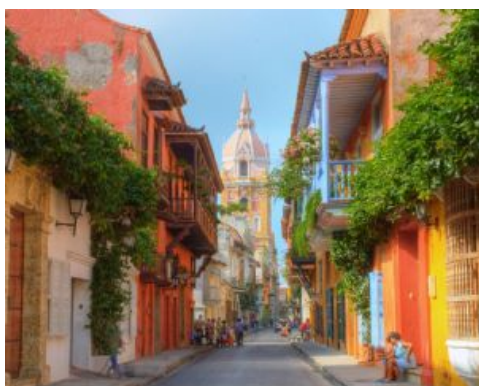
Cartagena de Indias

Precio por persona: 79 €. Pago directo. Esta cata debe reservarse mínimo 5 días de antelación y está sujeta a disponibilidad.