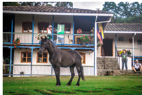
Planes de San Rafael