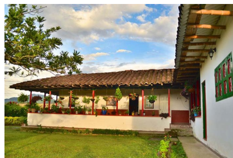
Hotel Finca del Café - Pereira