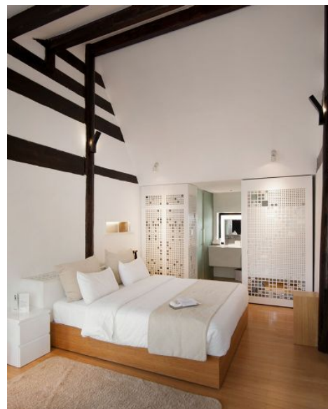
Hotel The Bivou