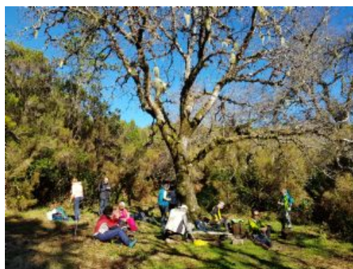
Trek Encumeada - Estanquinhos