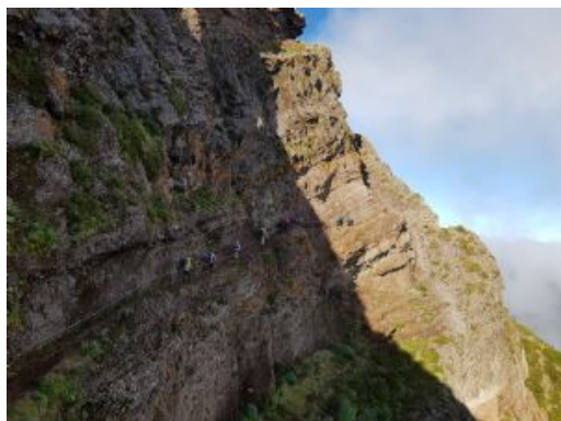
Trek Pico Areeiro - Pico Ruivo