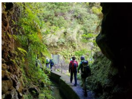
Trek Encumeada - Estanquinhos