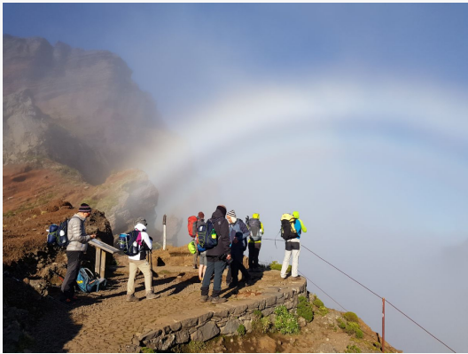
Trek Pico Areeiro - Pico Ruivo