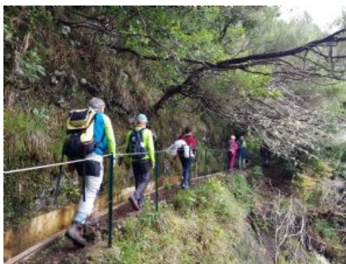
Trek Porto da Cruz - Ribeiro Frio