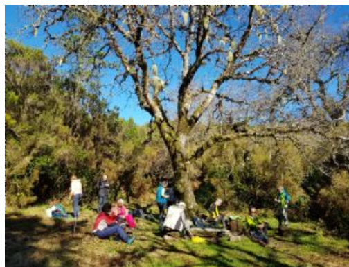
Trek Encumeada - Estanquinhos