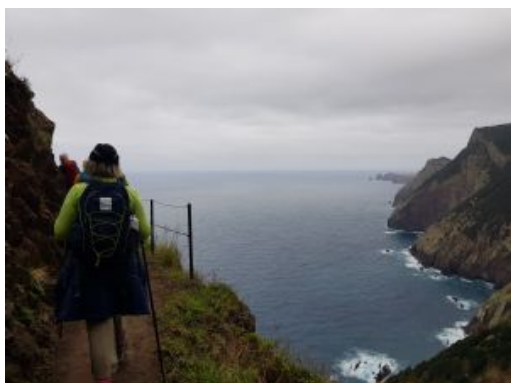
Trek Machico - Porto da Cruz