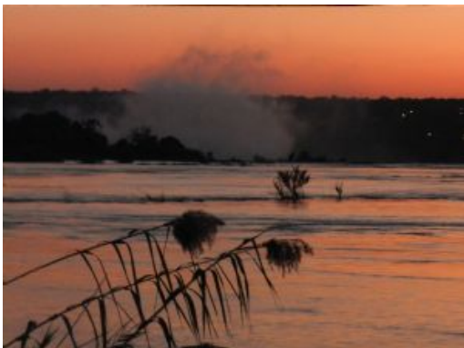
Puesta de sol en el Zambeze

El valle del Lower Zambeze es famoso por sus impresionantes vistas y la abundante vida salvaje que habita a lo largo de las orillas del río Zambezi. Este valle alberga tanto el Parque Nacional del Lower Zambezi (en las orillas de Zambia) como el Parque Nacional de Mana Pools (en las orillas de Zimbabwe), creando una vasta área protegida donde los animales pueden moverse libremente sin fronteras. Esta zona merece ser explorada tanto por río como por tierra para comprender plenamente la belleza salvaje de este lugar.