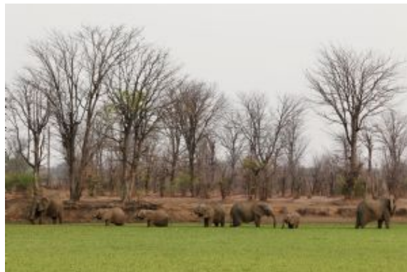
Lower Zambezi Safari