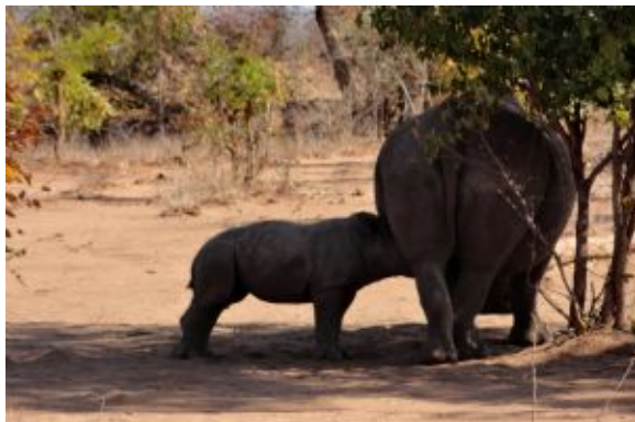
Mosi-oa-Tunya National Park

Día libre a disposición en la capital de la aventura africana. Existen múltiples actividades opcionales a realizar (desde sobrevuelos en helicóptero, hasta bungee jumping, rafting o cruceros al atardecer) que se pueden reservar por adelantado o directamente.