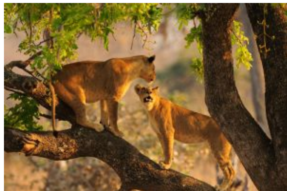
Leones en South Lungwa