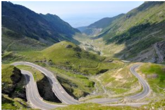
Carretera de Transfagarasan

Visitas sugeridas (entrada no incluida): Visita a la Iglesia Evangélica de Sibiu