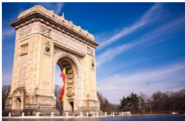
Arco de Triunfo Bucarest

Visitas sugeridas (entradas no incluidas): Visita al Palacio del Parlamento de Bucarest, Museo de Historia Nacional y visita al Museo Etnográfico del Pueblo Rumano.