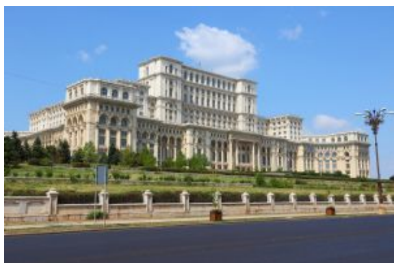
Palacio Parlamento Bucarest