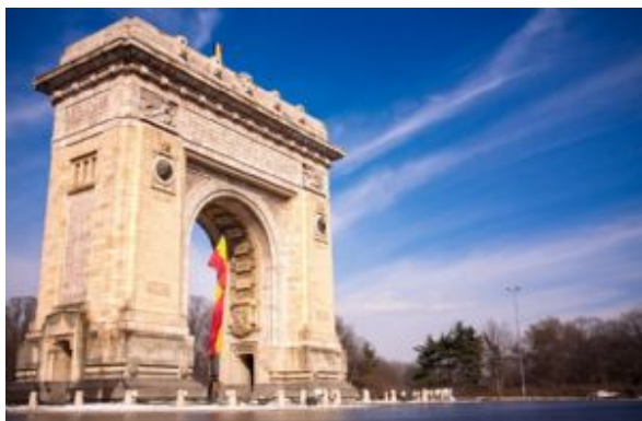
Arco de Triunfo Bucarest

Visitas sugeridas (entradas no incluidas): Visita al Palacio del Parlamento de Bucarest, Museo de Historia Nacional y visita al Museo Etnográfico del Pueblo Rumano.