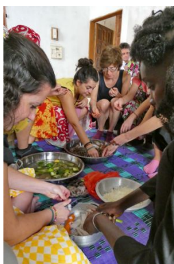
Saint Louis