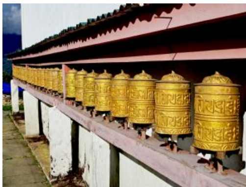
Trek Pikey Peak