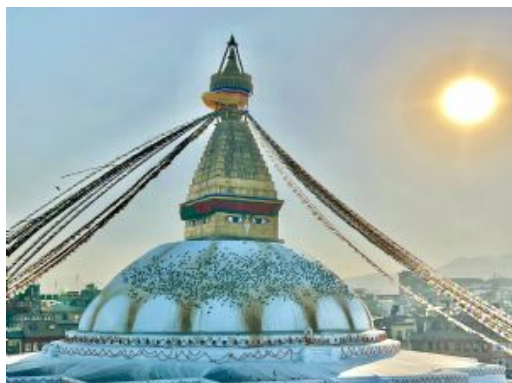
Kathmandu Estupa Boudhanath

A nuestra llegada al Aeropuerto de Katmandú, encuentro con nuestro representante para el traslado al hotel. Por la tarde, tendremos una primera toma de contacto con el país, haciendo un recorrido a pie por los santuarios sagrados cercanos incluyendo una visita a Ason Bazaar, conocido por su mercado de especias y verduras, así como a diversos centros espirituales de Katmandú, entre ellos Tsepum (Jarrón de la Larga Vida), Jamba Karmo (Tara Blanca) y Etum Bahal Tara Temple, un pequeño templo que alberga tres hermosas estatuas de Tara, donde se dice que quienes lo visitan quedan liberados de los reinos inferiores. Concluiremos el recorrido con una caminata hasta la estupa de Kathesimbhu, un popular lugar de peregrinación budista. Regreso al hotel y alojamiento.