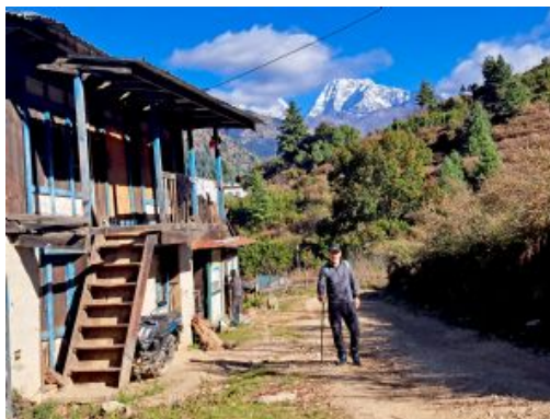
Trek Pikey Peak