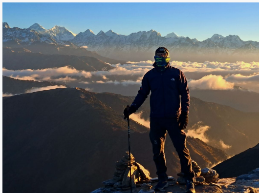
Trek Pikey Peak