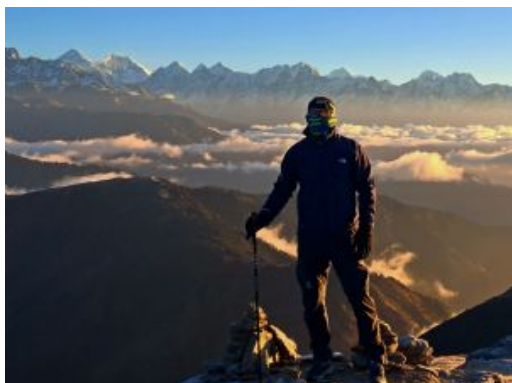
Trek Pikey Peak