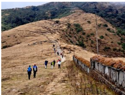
Trek Pikey Peak