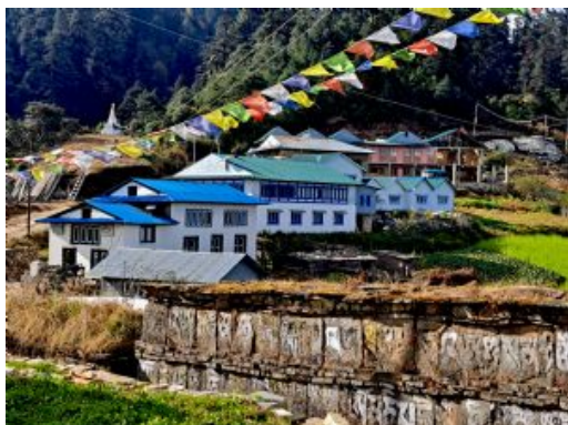
Trek Pikey Peak