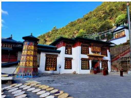
Trek Pikey Peak

Junbesi , es un encantador pueblo Sherpa ubicado en la región de Solukhumbu, en el este de Nepal. Se encuentra a una altitud de unos 2.700 m., sobre el nivel del mar. Este pueblo es conocido por su belleza natural y su rica cultura Sherpa, siendo un importante punto de parada para los excursionistas que realizan el trekking al campo base del Everest o al Pikey Peak. En este hermoso valle hay varios monasterios, siendo Thupten Chöling uno de los centros religiosos más importantes y activos.