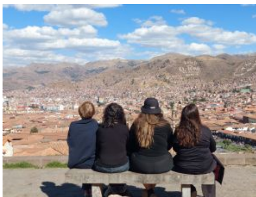
Contemplant la ciutat