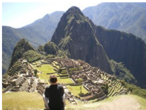
Peru Descubriendo Machu Picchu