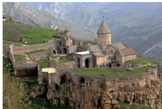
Monasterio de Tatev