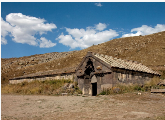
Caravansaray de Selim

El Caravasar, fue restaurado entre 1956 y 1959, preservando su importancia histórica como parte de la Ruta de la Seda en Armenia. Esta restauración ha permitido que se mantenga como el caravasar mejor conservado de Armenia hasta la actualidad.