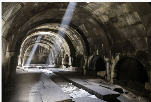
Caravansaray de Selim