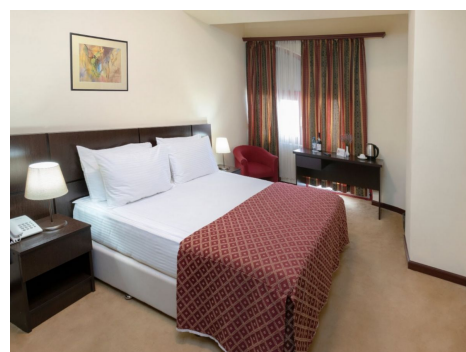
Hotel Ani Central