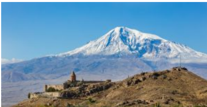
Khor Virap monastery and Mount Ararat, Armenia