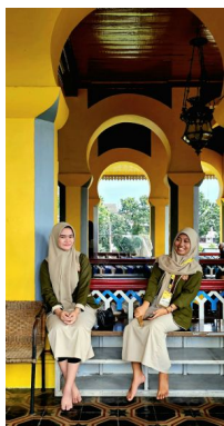
Palacio del Sultan