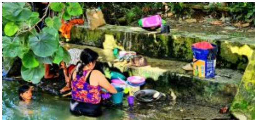
Aldea Real Bukit Lawang