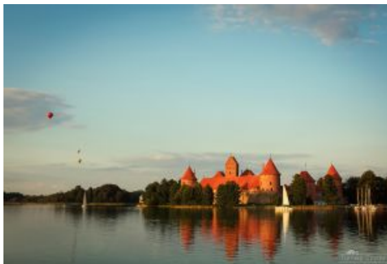
Castillo de Trakai