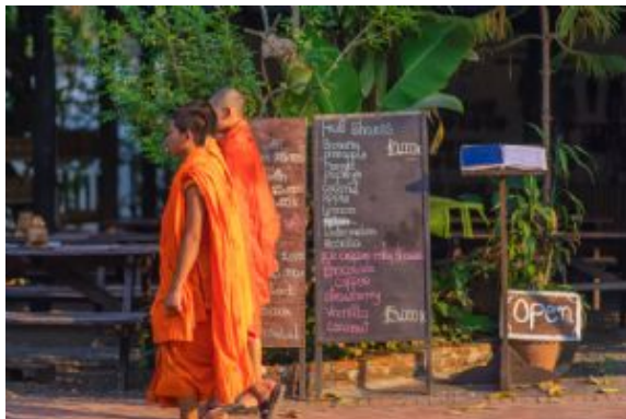
Foto: Luang Phrabang