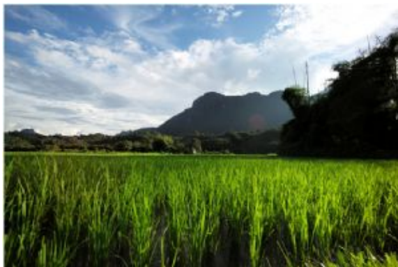
Vang Vieng 1