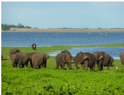
Minneriya National Park