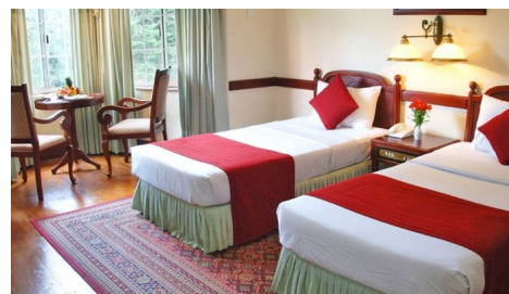
Hotel Grand, Nuwara Eliya