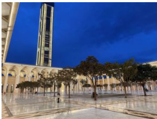
Mezquita de África