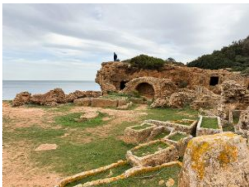
Ruinas en Tipasa