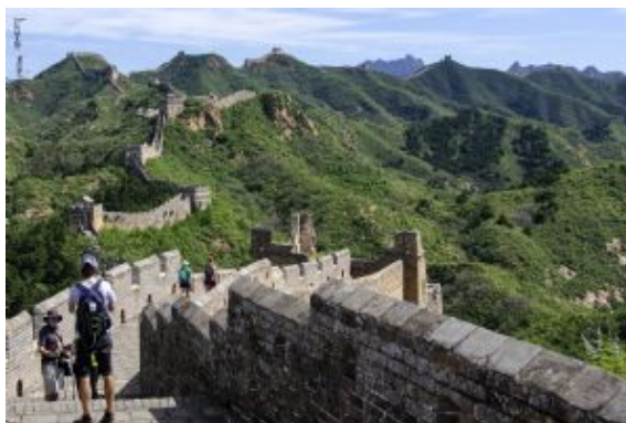
Gran Muralla 5