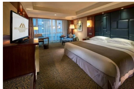
Kuntai Royal Hotel