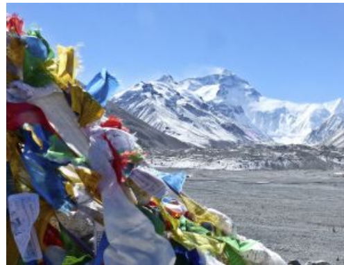
Josep Paga Foto: Tibet Camp base Everest