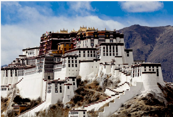
Palacio de Potala

Lo primero que hacen los peregrinos cuando llegan hasta este palacio que parece haber salido de la roca, es realizar la llamada kora, que es dar círculos en torno a él. Los más piadosos se postran ante él e incluso lloran por el exilio del Dalai Lama.