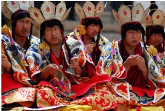
Juan A Vallejo Foto: Ritual de reencarnación Monasterio Sera Lhasa

Lhasa , la "ciudad santa" del Tíbet a 3650 metros de altitud, es el corazón espiritual de la nación tibetana. Hogar de monasterios como Sera, Ganden y Drepung, destaca por el Palacio de Potala, antigua residencia del Dalai Lama y Patrimonio de la Humanidad, con más de 1000 habitaciones y tesoros incalculables. También alberga Norbulingka, el Palacio de Verano con jardines y un zoológico, y el Monasterio de Jokhang, centro de peregrinación que alberga la estatua Jowo Buda Shakyamuni. Lhasa es la sede tradicional de los lamas y el centro más sagrado del budismo tibetano.