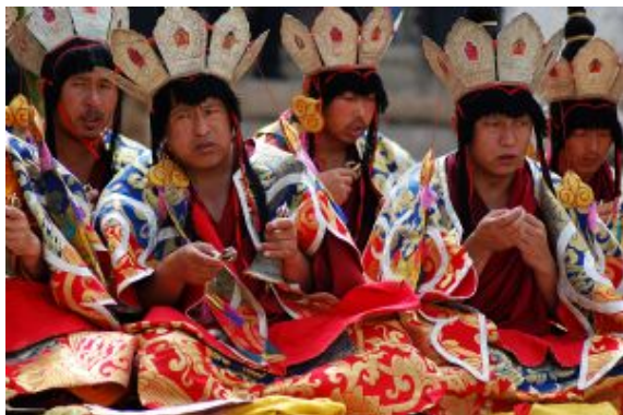
Ritual de reencarnación Monasterio Sera Lhasa

Lhasa , la "ciudad santa" del Tíbet a 3650 metros de altitud, es el corazón espiritual de la nación tibetana. Hogar de monasterios como Sera, Ganden y Drepung, destaca por el Palacio de Potala, antigua residencia del Dalai Lama y Patrimonio de la Humanidad, con más de 1000 habitaciones y tesoros incalculables. También alberga Norbulingka, el Palacio de Verano con jardines y un zoológico, y el Monasterio de Jokhang, centro de peregrinación que alberga la estatua Jowo Buda Shakyamuni. Lhasa es la sede tradicional de los lamas y el centro más sagrado del budismo tibetano.