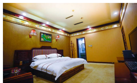
Hotel Shiga Yangcha_Shigatse