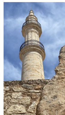
Fortezza de Rethymnon