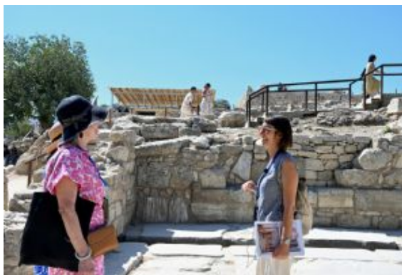
Palacio de Knossos