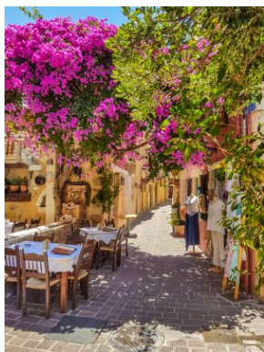
Casco antiguo de Chania