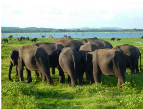
Minneriya National Park