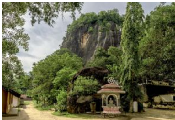
Mulgirigala Rock Temple

Trayecto en vehículo: 75 kms - 2,30 hrs aprox.