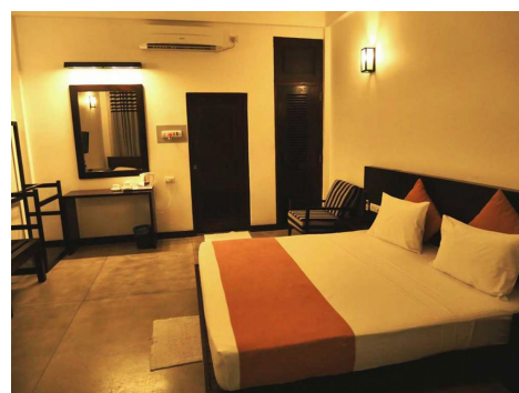
Hotel Lagoon Paradise