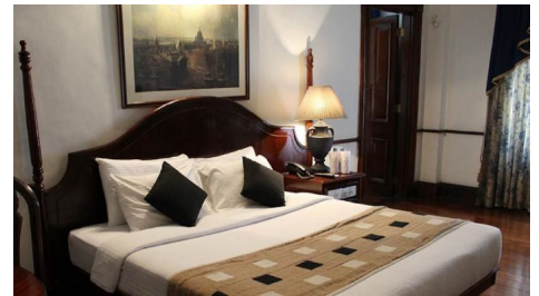
Hotel Queens, Kandy