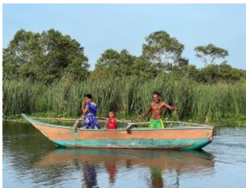
Laguna de Kalametiya