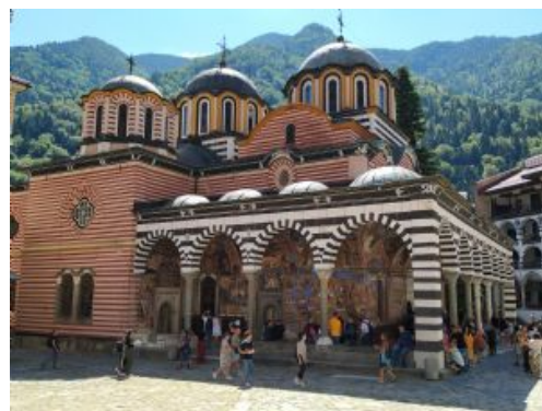
Monasterio de Rila