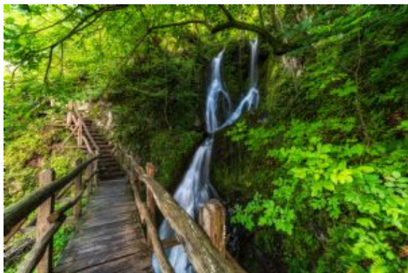
Eco senda Kalofer

Trayecto en vehículo: 200 km, 4 h aprox.