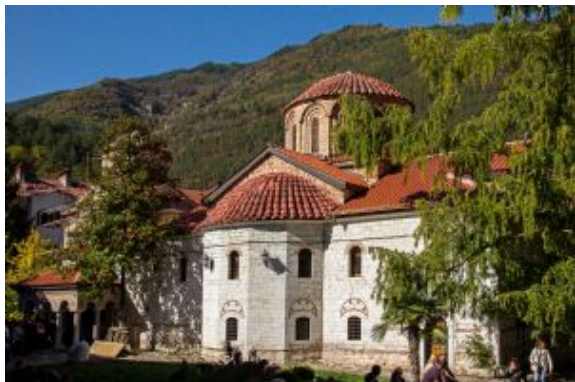
Monasterio de Bachkovo

Dedicamos el día completo a descubrir Plovdiv a pie. Recorremos el casco antiguo, situado sobre las colinas de Trimontium, enlazando subidas y bajadas que convierten la visita en un paseo activo. Visitamos el teatro romano, los restos de la fortaleza medieval y las casas del Renacimiento búlgaro. Entramos también en la Basílica Episcopal, con su notable colección de mosaicos paleocristianos. A mediodía disfrutamos de una comida con elementos de degustación de productos locales. Por la tarde, tiempo libre para seguir explorando la ciudad. Alojamiento en el mismo hotel.