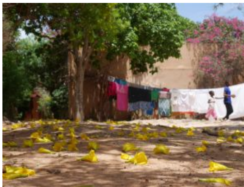
Isla de Gorée