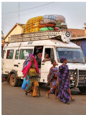
La furgoneta

Cabañas Impluvium casas circulares diola construidas en adobe, organizadas alrededor de un patio interior y diseñadas para recoger el agua de lluvia a través de una abertura central.