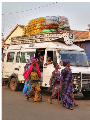
La furgoneta