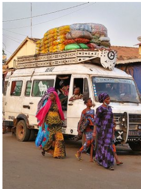
La furgoneta

Cabañas Impluvium casas circulares diola construidas en adobe, organizadas alrededor de un patio interior y diseñadas para recoger el agua de lluvia a través de una abertura central.