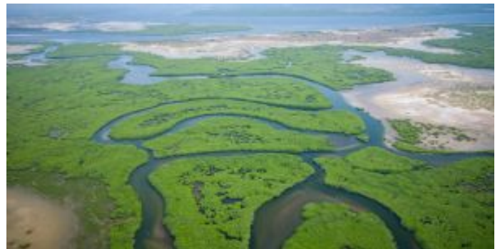
Delta del Saloum