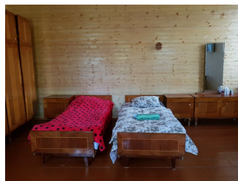
Alojamiento - Casa Rural