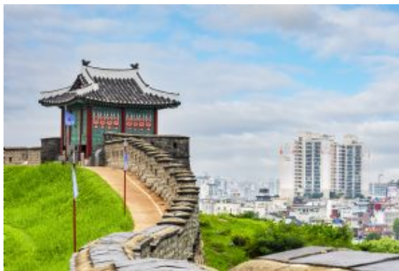
Fortaleza Hwaseong Suwon