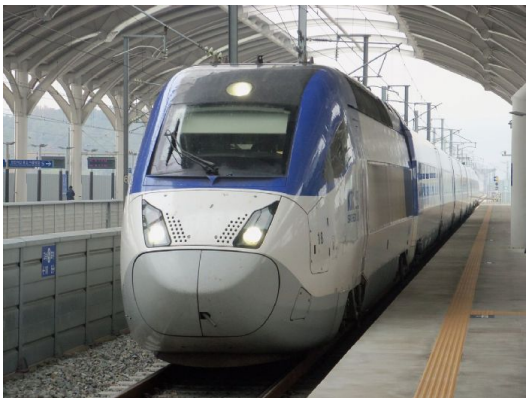
ktx - tren bala

Durante nuestro recorrido por Corea del Sur, utilizamos vehículos privados y confortables, adaptados al tamaño del grupo, para garantizar desplazamientos seguros, eficientes y agradables. Los trayectos entre ciudades, así como los traslados hacia aeropuertos, cuentan con conductores profesionales y asistencia local, permitiéndonos disfrutar del paisaje sin preocupaciones logísticas. Para vuelos internos, como los traslados entre Busan y Jeju o Jeju y Seúl, se coordinan con aerolíneas nacionales, asegurando horarios convenientes y comodidad durante el trayecto. En las visitas urbanas y excursiones, el transporte facilita acceder a los principales puntos de interés sin perder tiempo, combinando eficiencia con la posibilidad de relajarse y disfrutar del viaje desde el primer momento.