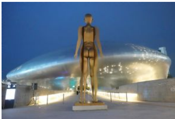
Dongdaemun Design Plaza