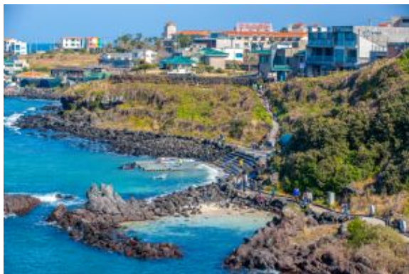
Jeju - Handam Coastal - Trail - Corea del Sur