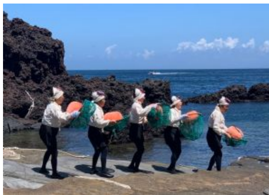
Buceadoras isla de Jeju