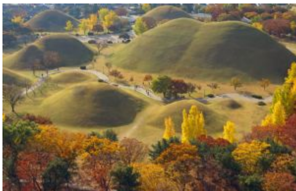
Gyeongju - Tumbas Reales