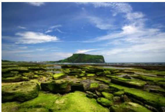
Jeju - Seongsan Ilchulbong Peak - Corea del Sur