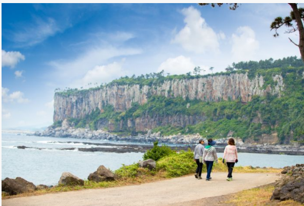
Jeju - Baksugijeon - Corea del Sur

Corea del Sur es un destino donde la historia milenaria convive con una modernidad vibrante, creando un país lleno de contrastes y sorpresas. Desde palacios centenarios y templos rodeados de montañas otoñales hasta mercados bulliciosos, rascacielos futuristas y costas de ensueño, cada rincón ofrece una experiencia única para los sentidos. Este viaje nos lleva también a la isla de Jeju, con sus paisajes volcánicos, bosques milenarios, playas de arena blanca y tradiciones únicas como la cultura Haenyeo y los té verdes de O'sulloc, completando un recorrido que combina naturaleza, historia y vida urbana. Diseñado para vivir Corea en profundidad, combinando cultura, naturaleza, gastronomía y momentos de contemplación, todo con acompañamiento experto y comodidad en transporte y alojamiento. Este viaje significa disfrutar de cada detalle sin preocupaciones, con la seguridad de que cada día está cuidadosamente planificado para que descubramos el país de forma auténtica, intensa y memorable.