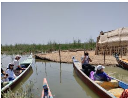
Marismas de Mesopotamia. Casas flotantes