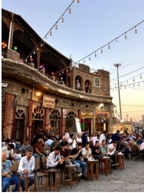
Kurdistan Irakià

A primera hora de la madrugada, traslado al aeropuerto para tomar el vuelo de regreso.