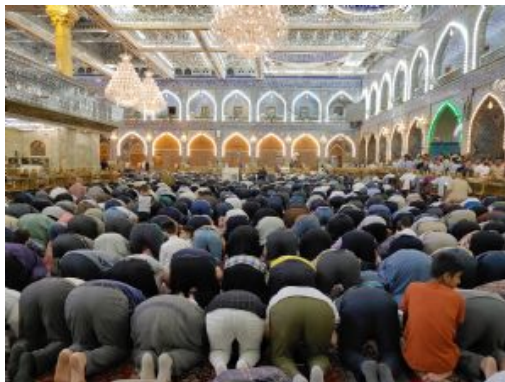
Karbala. Santuario de Hussein y Abbas