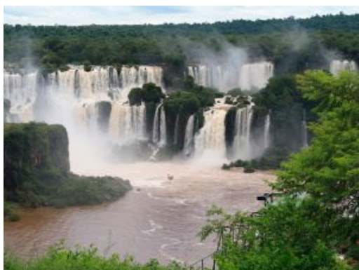
Foz do Iguazu

Desayuno. Libre en este espectacular entorno con frondosa vegetación y protagonizado por una de las cataratas más grandes y espléndidas del planeta. Día para conocer el lado brasileño de las cataratas, volar en helicóptero, etc. Alojamiento en el hotel.