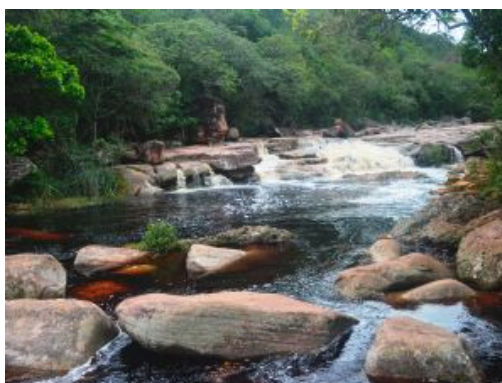
P.N. Chapada Diamantina