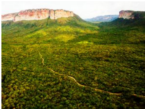
P.N. Chapada Diamantina

Regreso a Lençóis y alojamiento en hotel.