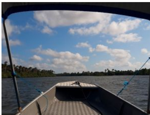
Río Parnaibas Barreirinhas