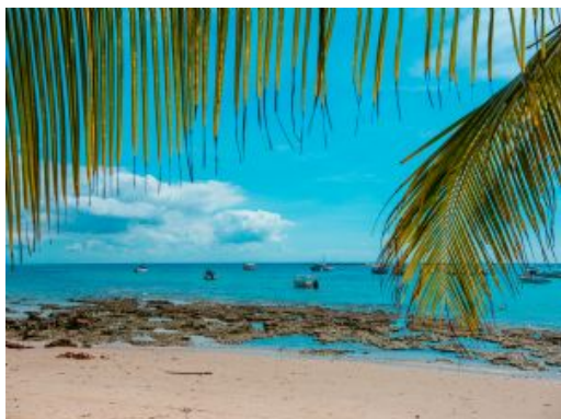
Morro São Paulo