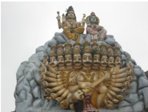
Escultura de Shiva

Trincomalee , ubicada en la costa este de Sri Lanka, es un destino que combina historia, cultura y playas de ensueño. Su puerto natural es uno de los más grandes del mundo y la ciudad ha sido testigo de diversas influencias coloniales a lo largo de los siglos. Entre sus principales atractivos destacan el histórico Fort Frederik, el majestuoso templo hindú de Konneswaram y las playas cercanas de arena dorada. Trincomalee también es conocida por su cercanía a paisajes naturales y parques marinos ideales para el avistamiento de fauna.