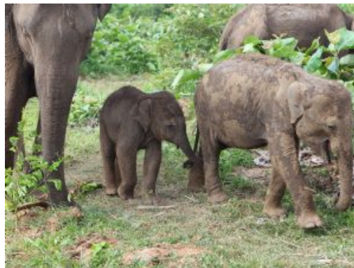
Elefantes en Udawalawe