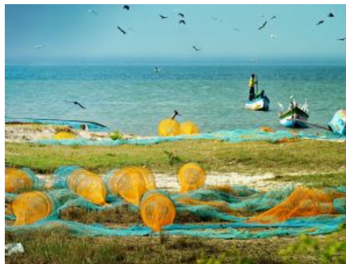
Pescadores en Jaffna