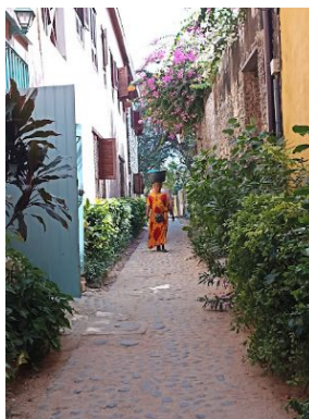
Isla de Gorée