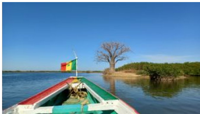
Delta del Saloum