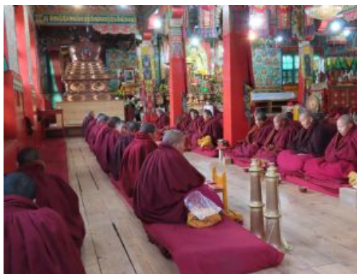
Trekking Pikey Peak