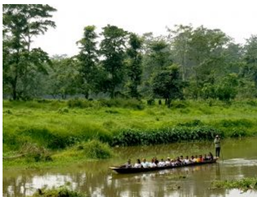
Chitwan National Park