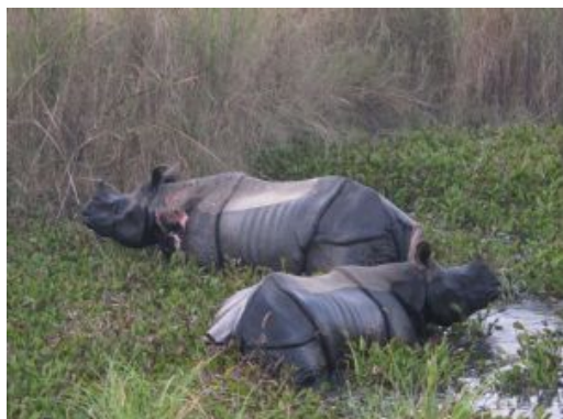
Chitwan National Park

Temprano por la mañana subiremos a Sarangkot, desde donde podremos contemplar uno de los más espectaculares amaneceres sobre el Annapurna y Machhapuchhre. La luz dorada sobre las cumbres es simplemente mágica. Tras regresar al hotel y desayunar, visitaremos la Cascada Devi's Fall, una impresionante caída de agua que se abre paso entre cuevas subterráneas y exploramos la Cueva de Gupteshwor, famosa por sus formaciones de estalactitas y estalagmitas, y finalizaremos con un recorrido por el campo de refugiados tibetanos, conociendo su cultura y artesanía local.