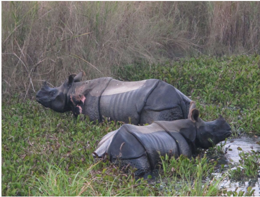
Chitwan National Park

Entre las actividades que se incluyen en la visita al parque están los safaris en jeep, paseos en canoa por el río, caminatas guiadas por la jungla y encuentros culturales con la comunidad Tharu, una de las etnias más antiguas de la región. Chitwan combina naturaleza, aventura y cultura en un entorno auténtico y accesible, ideal tanto para amantes de la fauna como para quienes buscan una experiencia exótica y diferente.