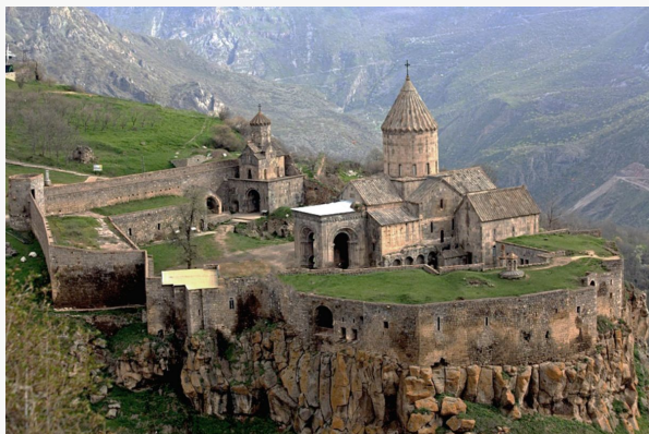
Monasterio de Tatev

Flotando silencioso en las montañas, el Monasterio de Tatev es muy impresionante. El laberinto de sus estrechos pasajes lleva desde sus espaciosas salas hacia otros edificios de propósitos inidentificados, ya que las siluetas de los nichos a través de la oscuridad, sus escaleras de piedra y sus arqueadas entradas, nos ofrece mucha una gran oportunidad por explorar.