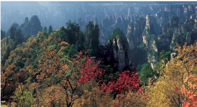
Zhangjiajie Nat. Forest