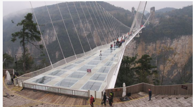
Grand Canyon Zhangjiajie