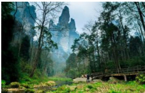
Golden Whip Stream Zhangjiajie