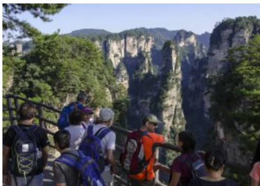
Zhangjiajie National Park