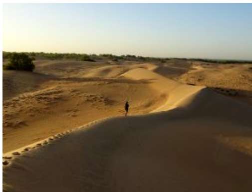
Amanece en el desierto de Lompoul