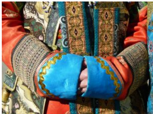
Naadam - luchadores

Durante esta jornada se celebra la ceremonia de apertura con la llegada de la bandera nacional al estadio. Asistiremos a la ceremonia inaugural en el estadio (previsto de 11 a 13 h) y a las primeras rondas de las competiciones de lucha. Por la tarde las calles de Ulan Bator ofrecen innumerables programas culturales y de entretenimiento paralelos. Por la noche tiene lugar un espectáculo pirotécnico de fuegos artificiales para celebrar la fiesta nacional