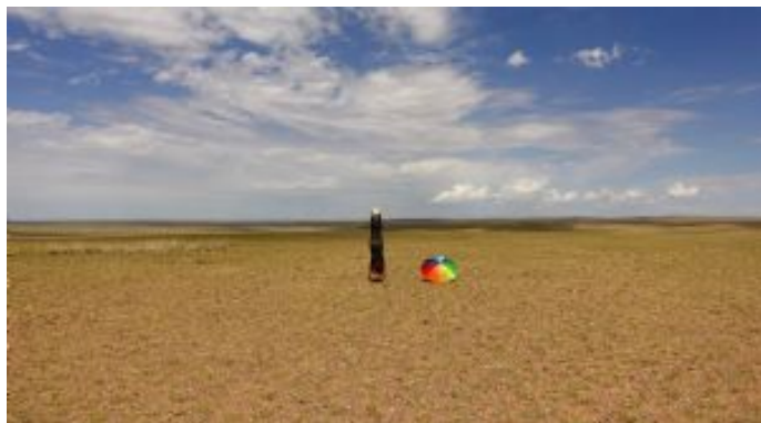
Desierto de Gobi