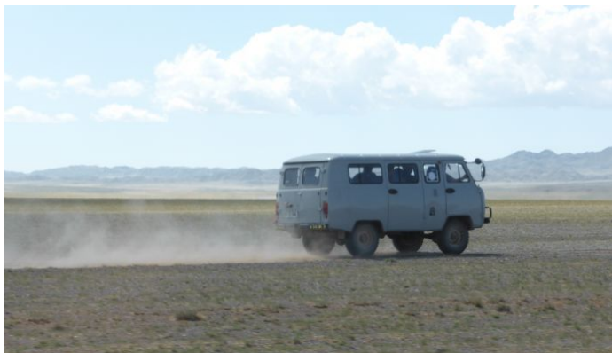
Transporte furgoneta