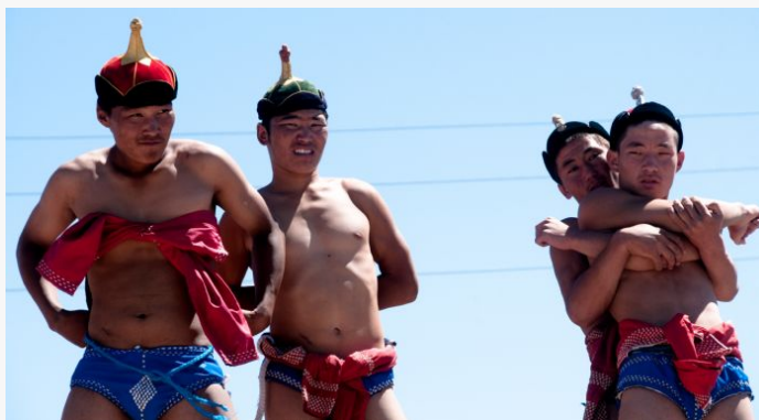
Naadam Calentando para la lucha