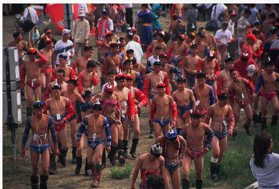
Naadam - luchadores