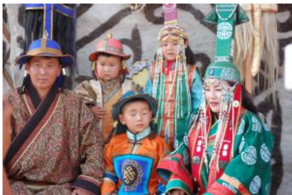
Vestidos para el Festival

Llegada a Ulan Bator y traslado al hotel. Tiempo libre hasta la hora del almuerzo. Por la tarde visita de la ciudad incluyendo el templo-monasterio de Gandan, el área de Sukhbaatar square y el Museo de Historia. En estas fechas previas a la Fiesta Nacional, la ciudad es un lugar apasionante en el que se reúnen viajeros de muy diversa procedencia