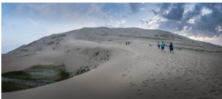
Hongoryn Els. Dunas gobi