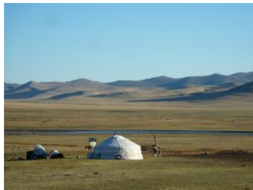
Valle de Orkhon