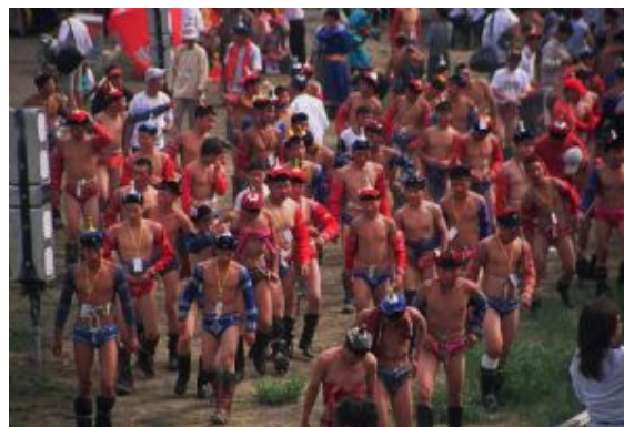
Carreras de caballos