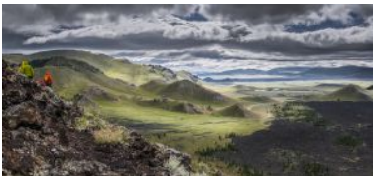
Descenso del volcán Khorgo