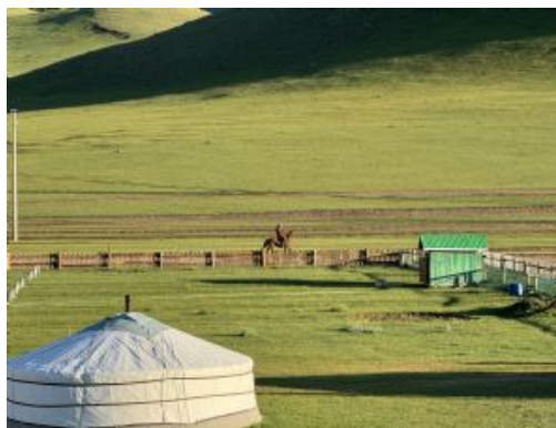
Valle de Orkhon