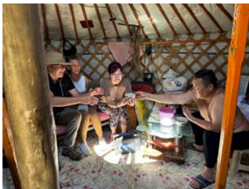
Te invito a un airak