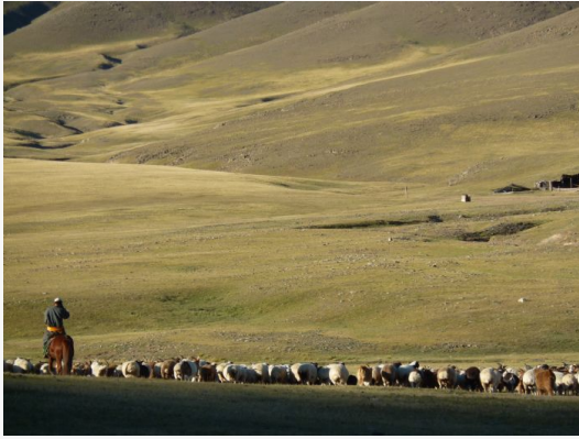
Pastor a caballo