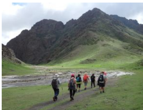
Desfiladero de Yoliin Am