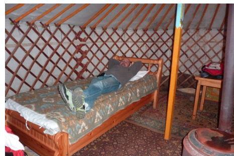
Interior de un Ger