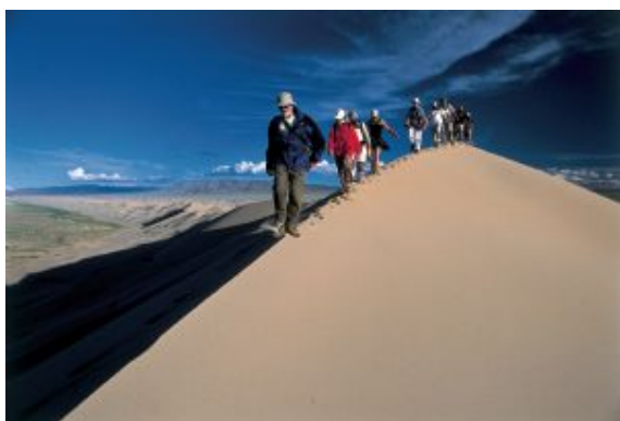
Dunas de Hongoryn Els

Cascadas de Orkhon- Khujirt:: 80 km/ 2,5 h + Khujirt-Ongii: 250 km/4,5 h