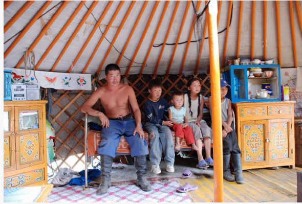
Familia en su ger